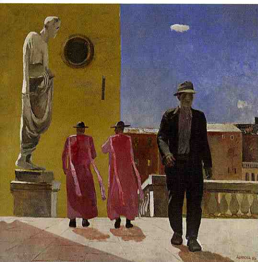
Strada romana, 1935, olio su tela Galleria Statale Tret'jakov, Mosca

pur coinvolta nelle finalità propagandistiche di regime, raggiunge una qualità formale e poetica che travalica le circostanze storiche in cui si è sviluppata, collocando la ricerca di quest'artista in una posizione di assoluto rilievo nella definizione dell'avanguardia realista europea. La mostra è realizzata in collaborazione con la Galleria Statale Tret'jakov di Mosca, istituzione che detiene la maggiore concentrazione di capolavori di Deineka, in grado di garantire alla rassegna di realizzarsi nel segno della completezza e dell'eccellenza qualitativa. Più di ottanta capolavori, provenienti oltre che