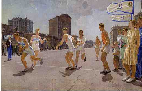
Staffetta, 1947, olio su tela Galleria Statale Tret'jakov, Mosca

Deineka di Kursk, si articolano in un percorso che abbraccia l'intera opera dell'artista, dagli anni Venti ai Sessanta e che contempla, oltre alla pittura, esempi della produzione grafica (disegni, illustrazioni, manifesti), plastica e monumentale. Il fondamentale viaggio di studio in Italia dell'artista, che nel 1935 soggiorna a Roma realizzando opere fondamentali, rende ancor più significativo il fatto che proprio a Roma si celebri la prima grande rassegna dedicata a questo grande talento fuori dai confini della sua patria.