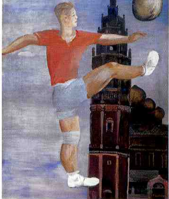
Calciatore, 1932, olio su tela Galleria A.A. Deineka, Kursk

quality. The crucial study trip that the artist made to Italy, staying in Rome in 1935 and producing some of his crucial works while in the