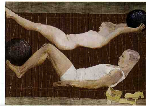
Ginnastica mattutina, 1932, olio su tela Galleria Statale Tret'jakov, Mosca

enormous amount of attention and interest in recent years. The thing that sets Deineka's art apart that of the other protagonists of the Socialist Realism movement is its exploration of form and aesthetics. While partaking wholeheartedly in the regime's propaganda drive, which was so much a part of that movement, Deineka's art nevertheless achieves formal and poetic heights that transcend the historical circumstances in which it was produced, ensuring that he occupies a position of the greatest importance in defining the European realist avant-garde. The exhibition has been devised and produced in cooperation with the Tret'jakov National Gallery, which owns the largest concentration of masterpieces by Aleksandr Deineka, guaranteeing that any retrospective of his work is complete and of the highest