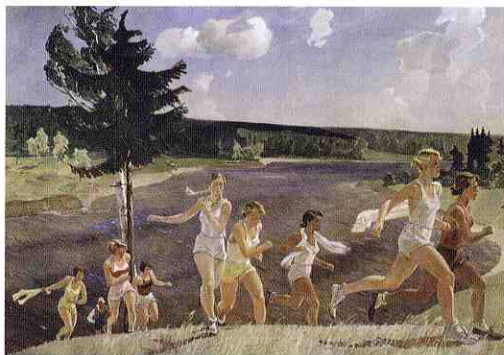
Corsa campestre, 1944, olio su tela Museo Russo, San Pietroburgo

Aleksandr Deineka (Kursk, 1899 – Mosca, 1969), compie i suoi primi studi artistici a Charkov, dove rimane fino alla Rivoluzione. Trasferitosi a Mosca all'inizio degli anni '20, diventa rappresentante dell'avanguardia radicale, a favore di un'arte orientata verso il linguaggio delle masse, caratterizzata da temi contemporanei, industriali e sportivi. Oltre a dipinti, sculture e opere grafiche, realizza pannelli monumentali per gli spazi pubblici che celebrano la grandezza della nazione