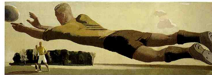
Portiere, 1934, olio su tela Galleria Statale Tret'jakov, Mosca

The very first event to be staged in the context of the Italian-Russian interministerial agreement on the exchange of cultural initiatives between the two countries, this exhibition is the first monographic presentation, outside Russia, of the work of Aleksandr Deineka (1899-1969), the Soviet Union's greatest and most famous realist painter and one to whom the leading critics of 20th century art have been devoting an